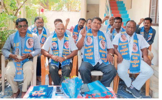
శేనార్తి మీడియా, మంచెర్యాల