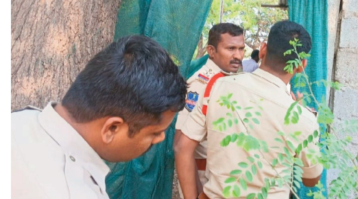
శేనార్తి మీడియా, శంకరపట్నం

శంకరపట్నం మండలం వంకాయ గూడం గ్రామంలో కిరాణా దుకాణంలో దొంగతనం జరిగినట్లు స్థానికులు తెలిపారు. కిరాణా దుకాణంలో మహిళా సంఘాలకు సంబంధించిన 12 వెల నగదు క్యాష్ కౌంటర్ లో 600 వందల నగదు న దొంగలు కిరాణా దుకాణం తలుపులకు ఉన్న గొల్లన్న ఊడదీసి కౌంటర్ లో దాచిన సొమ్మును దొంగలు దోచుకొన్నారు. గురువారం తెల్లవారుజామున కిరాణా దుకాణంలోకి వెళ్లిన షాప్ యజమాని తలుపులు తీసి ఉండడంతో దొంగతనం జరిగినట్లు అనుమానం కలిగి పోలీసులకు సమాచారం అందించారు. దొంగతనం జరిగిన కిరాణా దుకాణాన్ని కేవలపట్నం ఎస్సై రవి పరిశీలించారు.