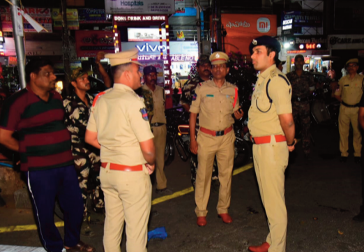
శెనార్తి మీడియా, కరీంనగర్