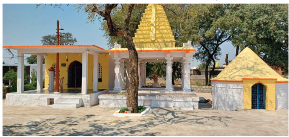
శెనార్తి మీడియా, బెజ్జంకి