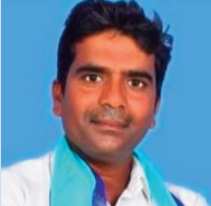
శెనార్తి మీడియా, గన్నేరువరం