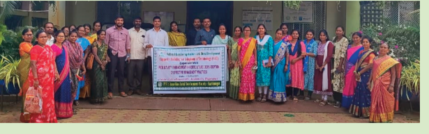
శేనార్తి మీడియా, చౌవ్వదండి