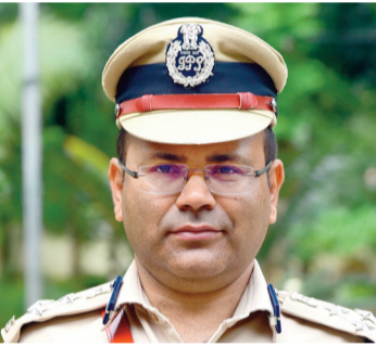
శెనార్తి మీడియా, మంచిర్యాల / గోదావరిఖని