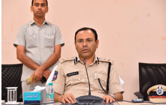
శెనార్తి మీడియా, మంచిర్యాల / గోదావరిఖని